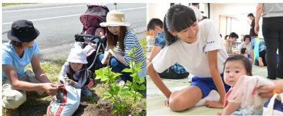
充実した子育て支援