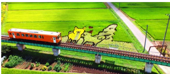
秋田内陸縦貫鉄道 田んぼアート