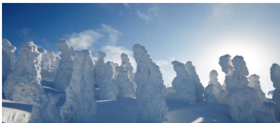
日本三大樹氷鑑賞地 森吉山

北秋田市は秋田県の北部中央に位置し、市内の『大館能代空港』から東京・羽田空港まで約70分とアクセスも良好です。面積は1152.76km 2 （東京23区の合計面積の約2倍）あり、秋田県の中でも2番目の広さを誇ります。その多くは豊かな自然に囲まれ、四季の移り変わりに合わせ、様々な表情を見せてくれます。