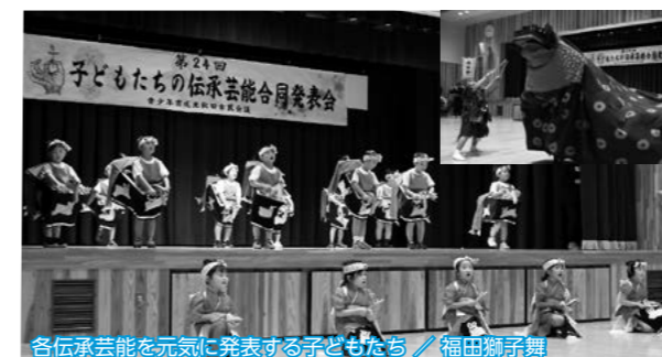
各伝承芸能を元気に発表する子どもたち/福田獅子舞

「第24回子どもたちの伝承芸能合同発表会」が合川公民館で開催され、4団体の子どもたちが地域の伝承芸能を披露しました。子どもたちの元気な演舞に、大きな拍手が送られ、会場内は活気で満ちあふれていました。