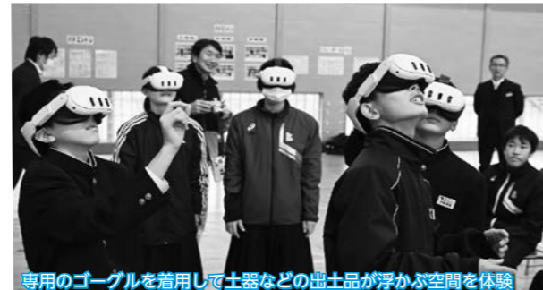
専用のゴーグルを着用して土器などの出土品が浮かぶ空間を体験

遺跡の出土品が3次元空間に浮かび上がる「伊勢堂岱キューブ」をさらに発展させた「みどころキューブMR体験」の実証実験が鷹巣中学校で行われ、生徒たちはデジタル技術による新しい文化鑑賞システムの体験を楽しみました。