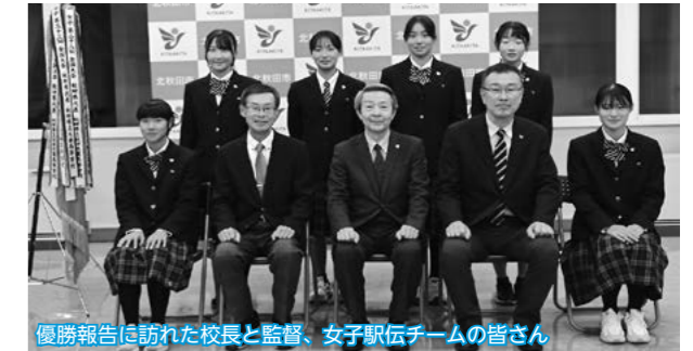
優勝報告に訪れた校長と監督、女子駅伝チームの皆さん

「第36回全国高等学校女子駅伝競走大会秋田県予選大会」で優勝を果たした秋田北鷹高校陸上競技部女子駅伝チームのメンバー6人が市役所を訪れ、津谷市長に優勝と全国大会への出場を報告しました。