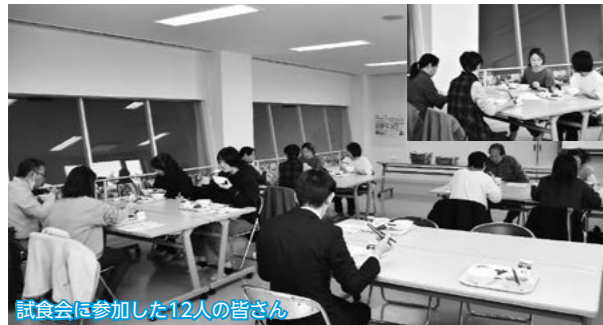
試食会に参加した12人の皆さん

市内小中学校の児童生徒に提供している学校給食に理解を深めてもらおうと「学校給食試食会」がもりよし学校給食センターで行われ、参加者は学校給食を味わいながら、栄養バランスのとれた給食への理解を深めました。