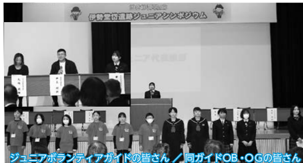
ジュニアボランティアガイドの皆さん/同ガイドOB・OGの皆さん

結成10周年を迎える伊勢堂岱遺跡ジュニアボランティアガイドの「伊勢堂岱遺跡ジュニアシンポジウム」が市民ふれあいプラザで開催され、これまでの歩みを振り返りながら今後の活動につなげる活動報告や意見発表を行いました。