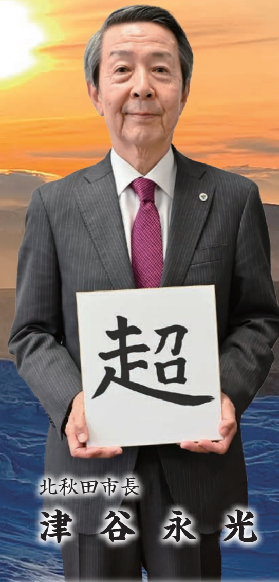
北秋田市長 津谷 永光