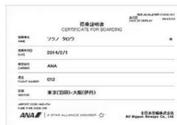
▲ANAウェブサイトから発行する搭乗証明書