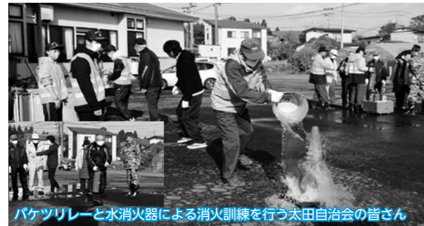
バケツリレーと水消火器による消火訓練を行う太田自治会の皆さん

「秋の火災予防運動」に合わせた想定訓練が市内4か所で行われ、参加者は有事に備えた防災意識を高めていました。太田地区では、高校生消防クラブも参加し、太田児童館で消火、倒壊家屋救出、応急救護の各訓練が行われました。