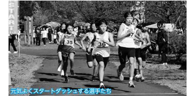
元気にスタートダッシュする選手たち

「ランニングフェスティバル2024」が北欧の杜公園特設周回コースで行われ、小学生から一般まで紅葉色づく秋の公園内を快走しました。ランナーたちはコース添いの仲間から大きな声援を受けてゴールを駆け抜けました。