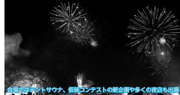
会場ではデントサウナ、仮装コンテストの新企画や多くの夜店も出展

第32回北秋田市「米代川花火大会」が河川緑地を会場に開催され、今回は10月開催となりましたが、多数の花火見物客が約1,500発の秋の夜空に輝く大輪を楽しむとともに、その迫力と美しさに酔いしれていました。