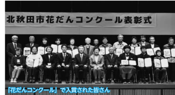
「花だんコンクール」で入賞された皆さん

花と緑に囲まれたうらおいのあるまちづくりを推進するため、魅力あふれる花だんを対象にした「花だんコンクール」の表彰式が市民ふれあいプラザで行われ、入賞した個人や団体の皆さんに賞状が授与されました。