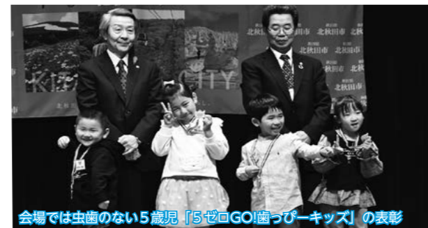
会場では虫歯のない5歳児「5ゼロGO!歯っぴーキッズ」の表彰

子どもから大人まで世代を超えて幅広く食に関心を深めてもらおうと「食育フェスタ」が市民ふれあいプラザで開催され、参加者は特別講演や展示・体験コーナーなどを通して食育への理解と関心を高めていました。