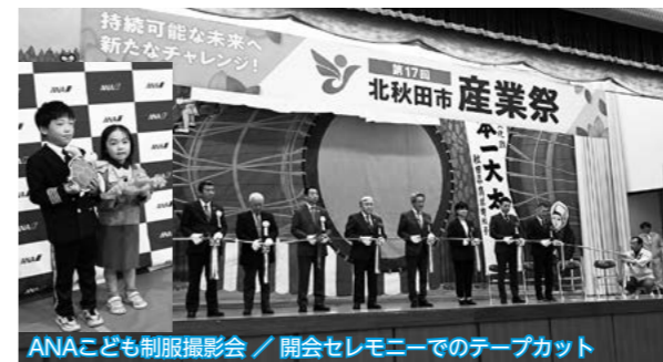
ANA子ども制服撮影会 / 開会セレモニーでのテープカット

地域の産業振興と経済活性化をねらいとした「産業祭」が2日間にわたり鷹巣体育館を会場に行われ、商・工・農全般の展示品や特産品の販売、多彩なイベントなどにより多くの来場者でにぎわいました。