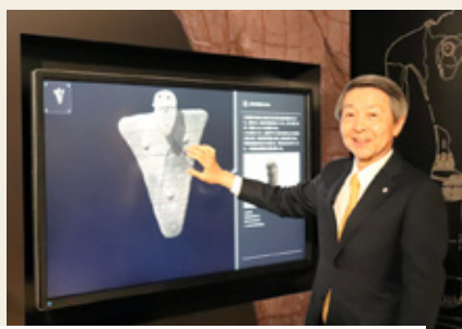
伊勢堂岱遺跡管理事業