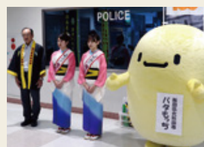
北秋田市観光物産協会 補助金