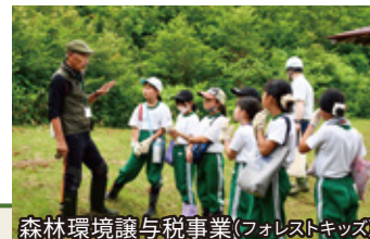
森林環境譲与税事業(フォレストキッズ)