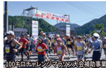
100キロチャレンジマラソン大会補助事業