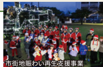
市街地賑わい再生支援事業