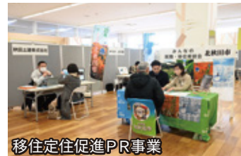
移住定住促進PR事業