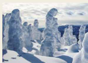
日本三大樹氷ブランド化 誘客推進事業