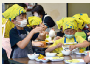
育児等健康支援事業 「食育ジュニア」