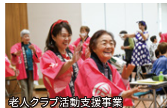
老人クラブ活動支援事業