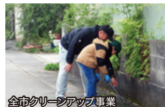
全市クリーンアップ事業