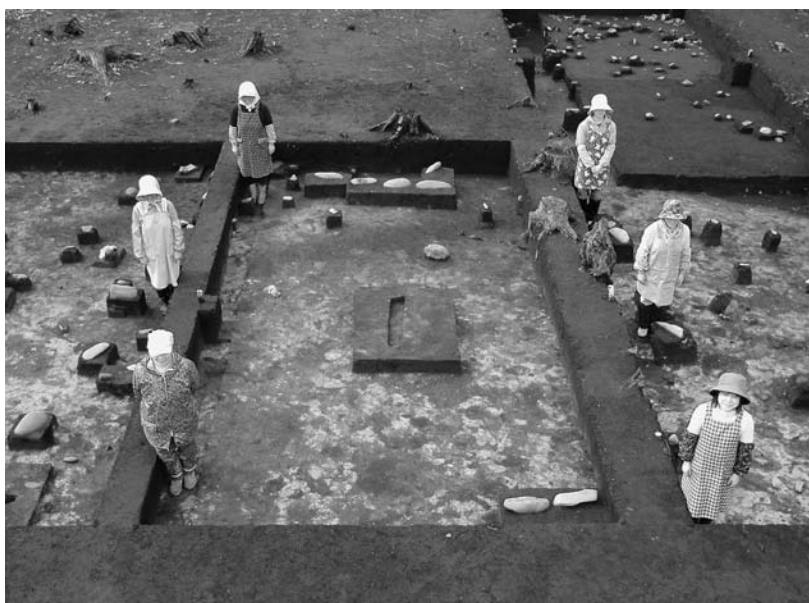
写真33 エリア①-1 掘立柱建物跡 13SB406(東→)