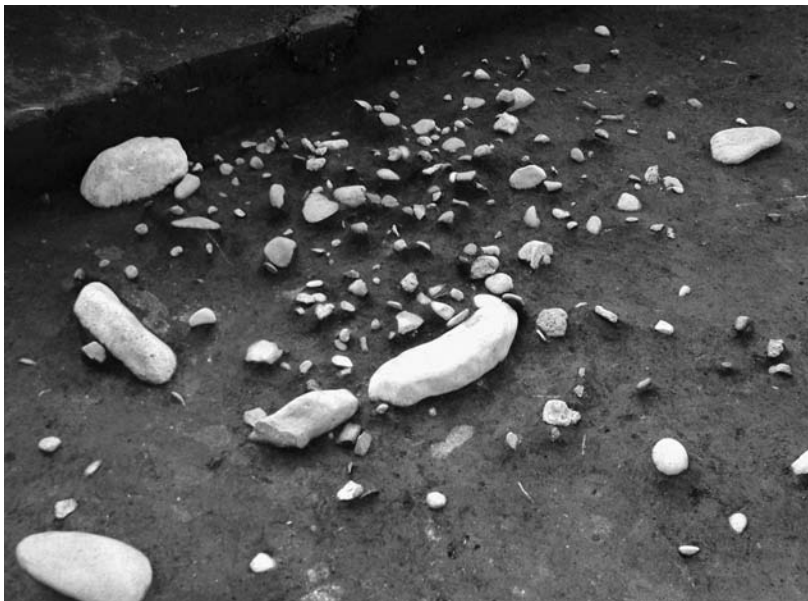
写真50 エリア①- 1 環状列石Dブロック13小礫分布 状況(南東→)