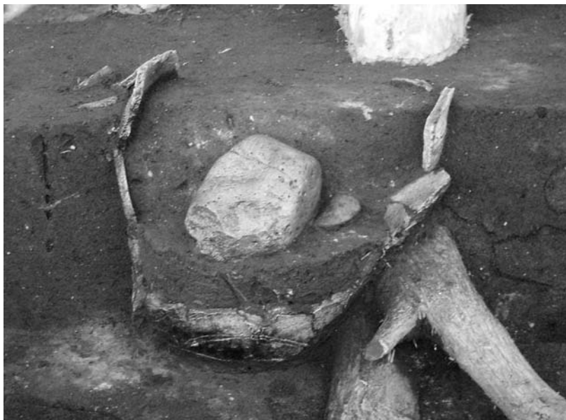
写真55 エリア①-1 埋設土器10SR01(西→)