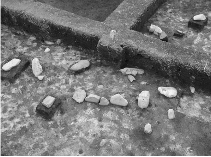
写真40 エリア①-1 13SQ408(北東→)