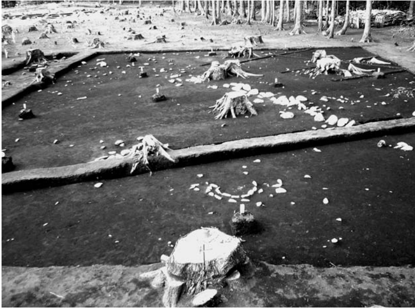
写真46 エリア①-1 環状列石D外帯(南→)