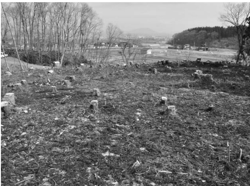
写真60 エリア①-2 近景(南→)