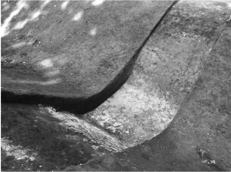
写真70 エリア①-3 空堀北側部分(南東→)