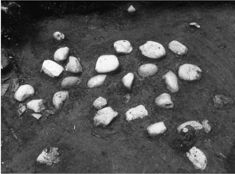
写真64 エリア①-2 配石遺構 5 SQ02(北→)