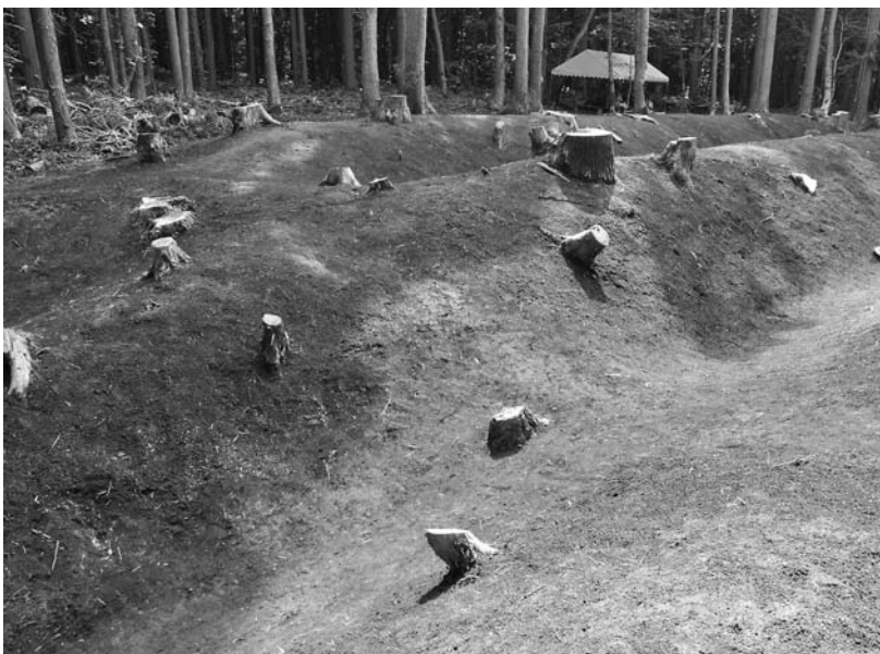
写真66 エリア①-3 壕(北東→)