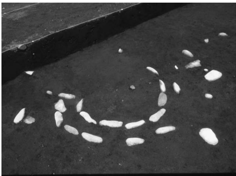
写真45 エリア①-1 環状列石Dブロック02(南西→)