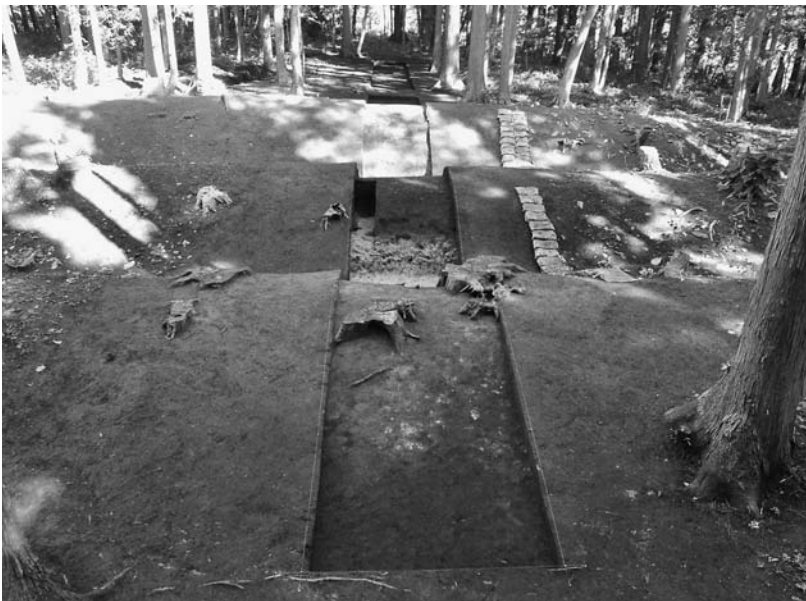
写真68 エリア①-3 17次トレンチ(南→)