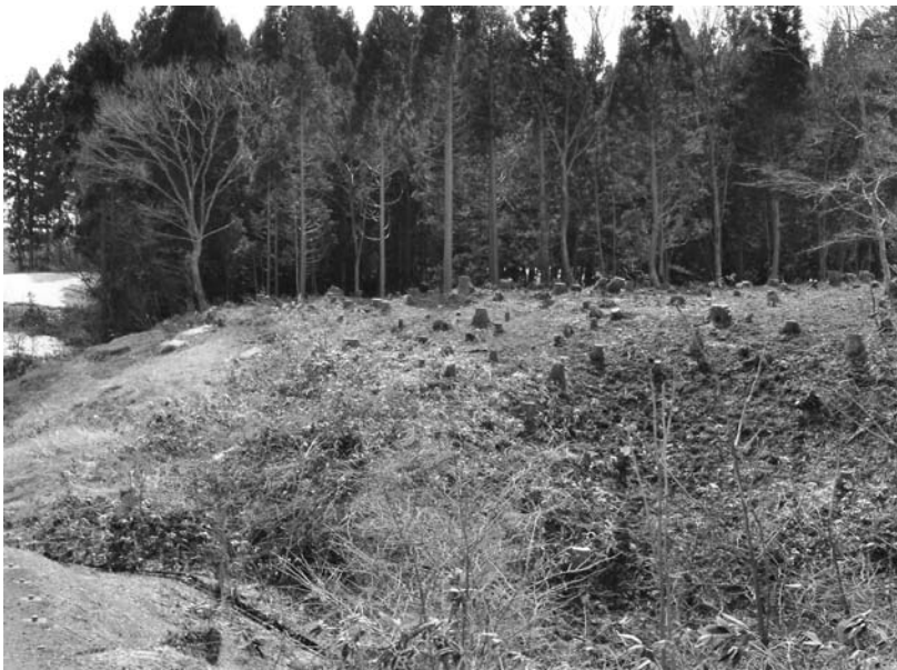
写真59 エリア①-2 遠景(北西→)