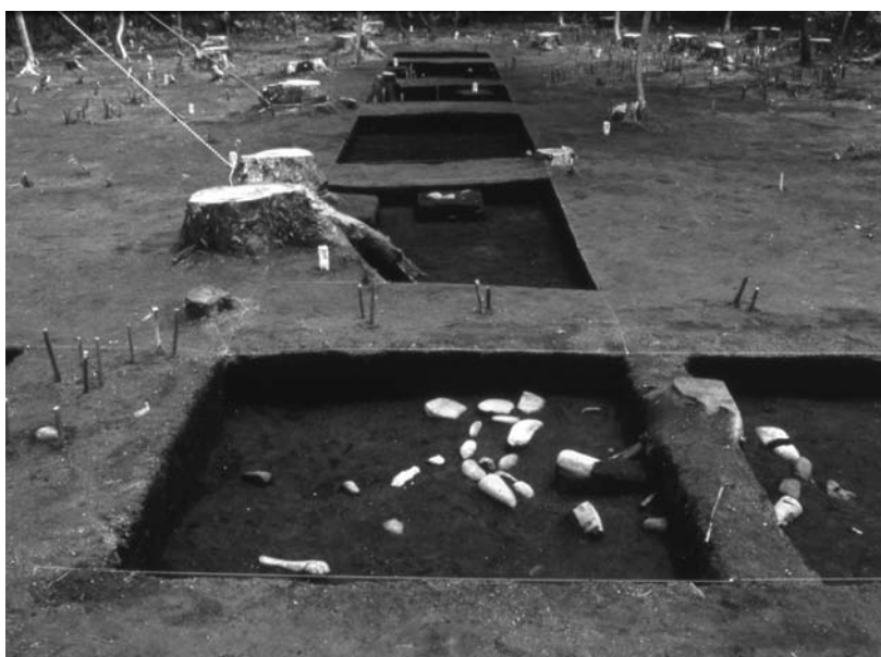
写真44 調査区① 環状列石Dブロック01(内帯) (南西→)