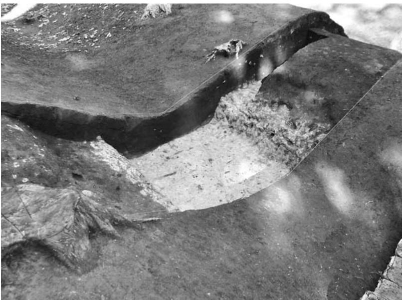
写真69 エリア①-3 空堀南側部分(南東→)