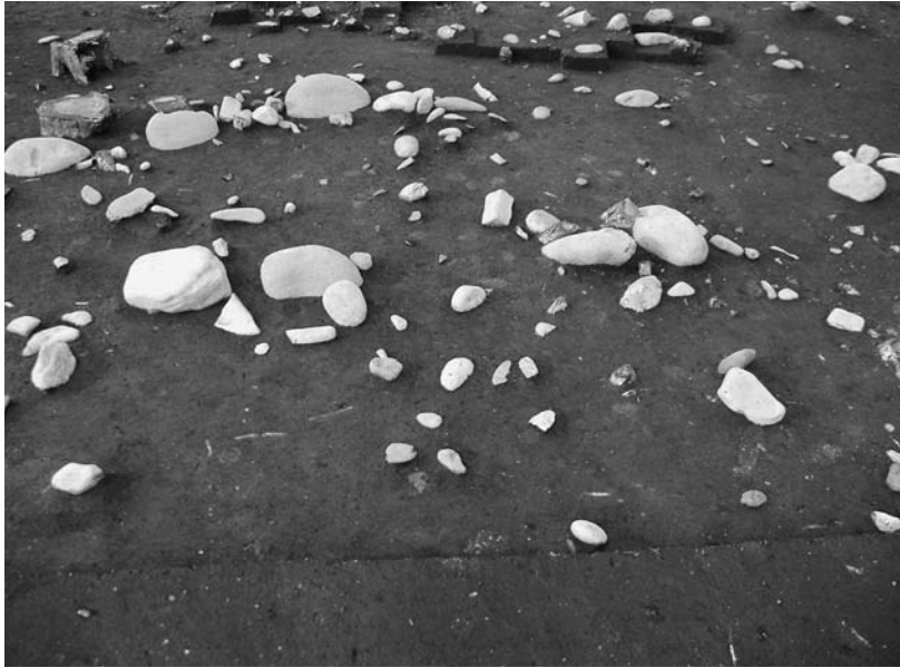
写真49 エリア①- 1 環状列石Dブロック12(南→)