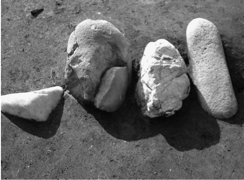
写真52 エリア①- 1 環状列石Dブロック18(東→)