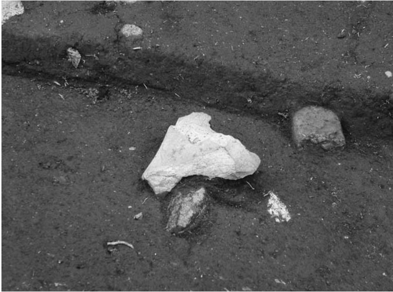
写真58 エリア①-1 三脚石器出土状況(西→)