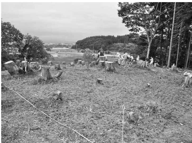
写真63 エリア①-2 ハンドボーリング探査