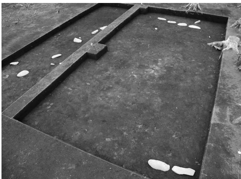
写真32 エリア①-1 掘立柱建物跡 13SB406(北東→)