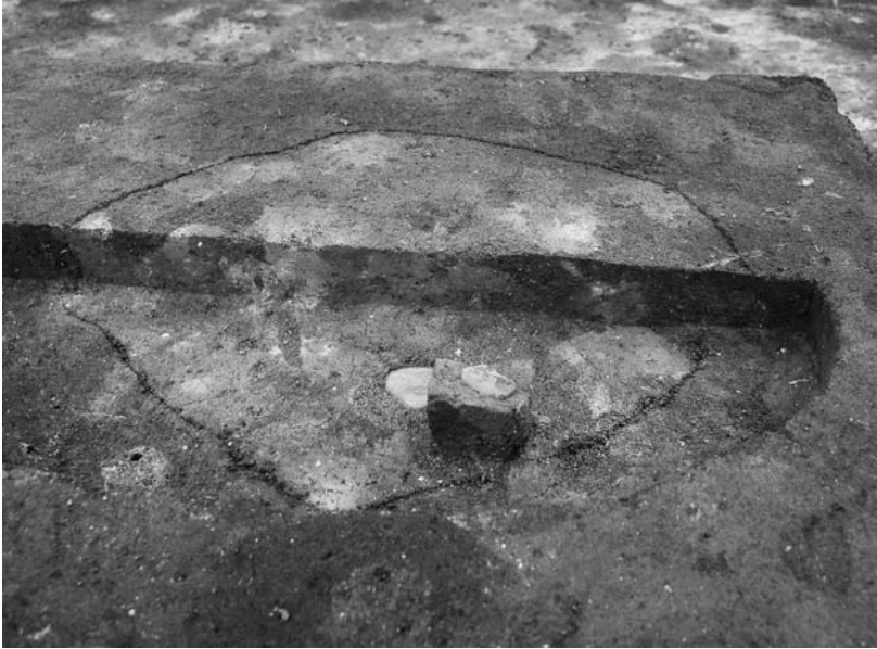
写真34 エリア①-1 地焼炉13SN547(南→)