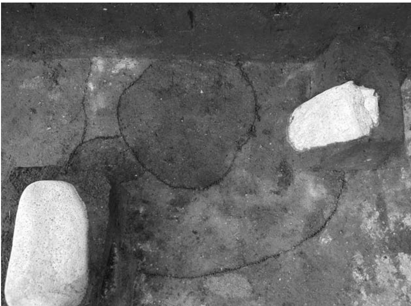
写真35 エリア①-1 柱穴13P545(南→)