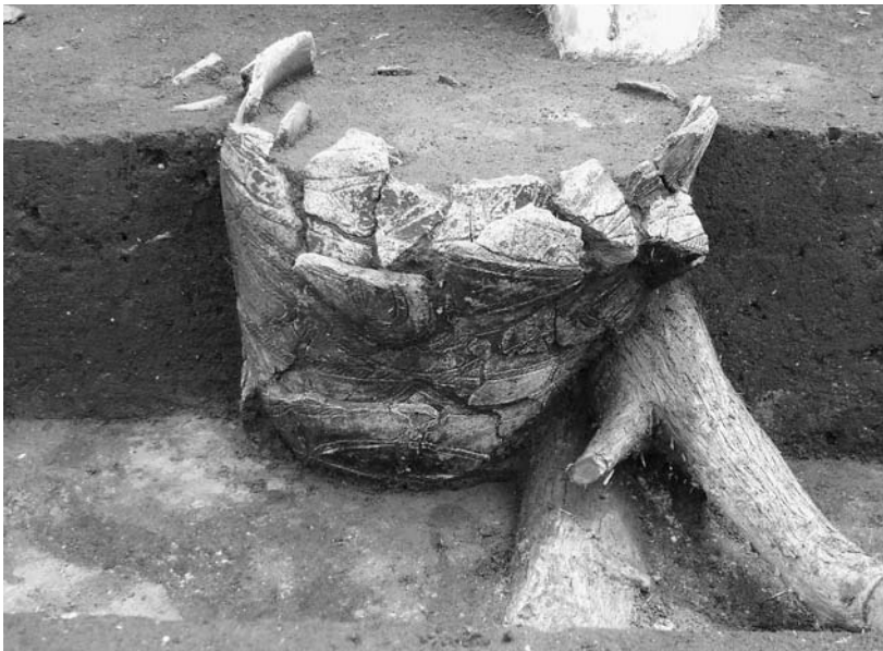
写真54 エリア①- 1 埋設土器10SR01(西→)