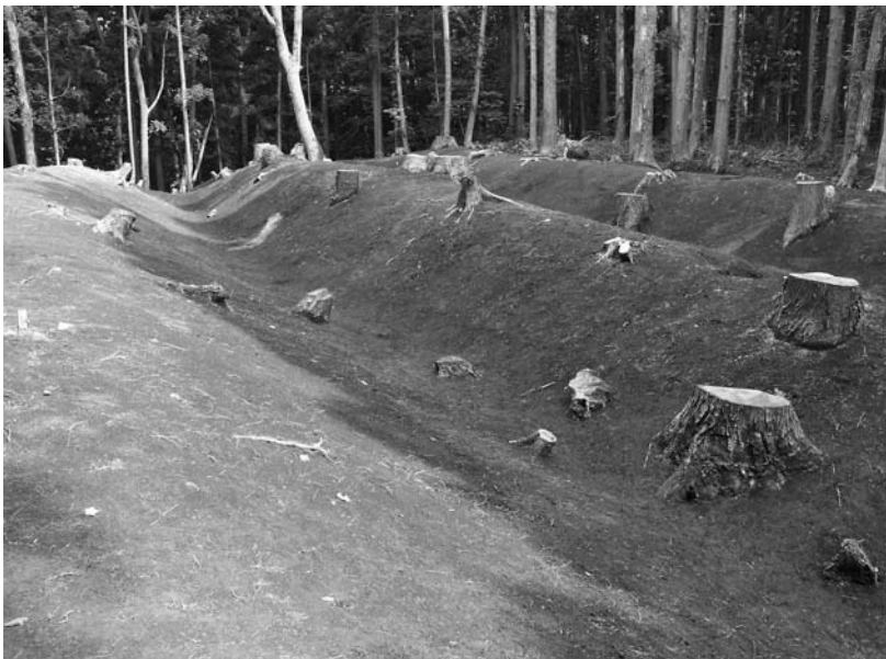
写真65 エリア①-3 壕(北西→)