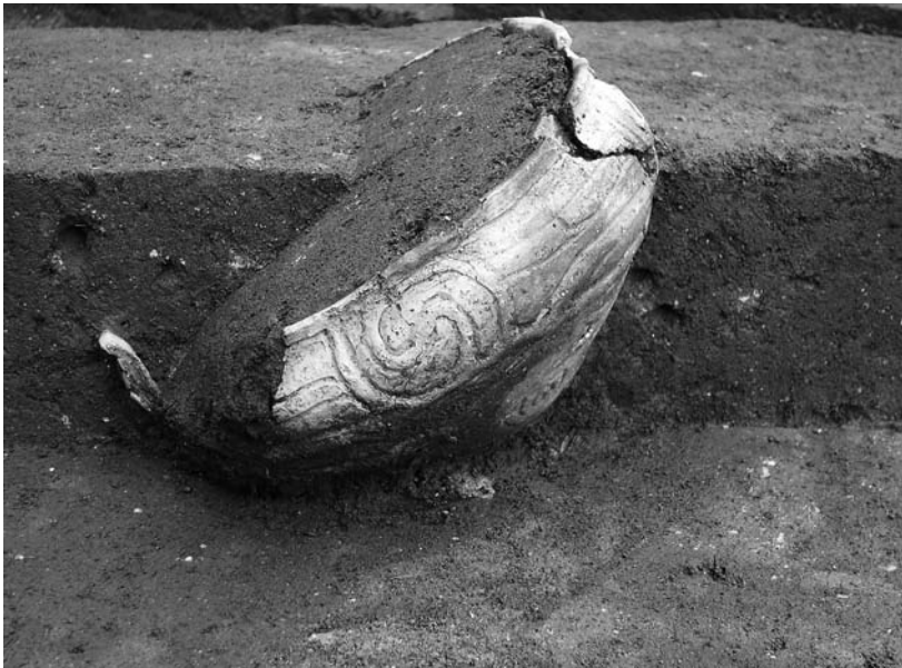
写真53 エリア①- 1 環状列石D出土鉢(北西→)