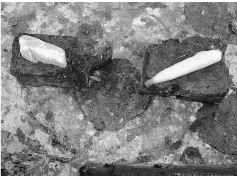
写真36 エリア①-1 柱穴13P460(南→)