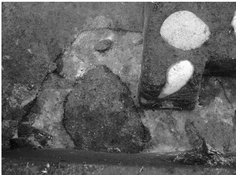
写真37 エリア①-1 柱穴13P462プラン(南→)