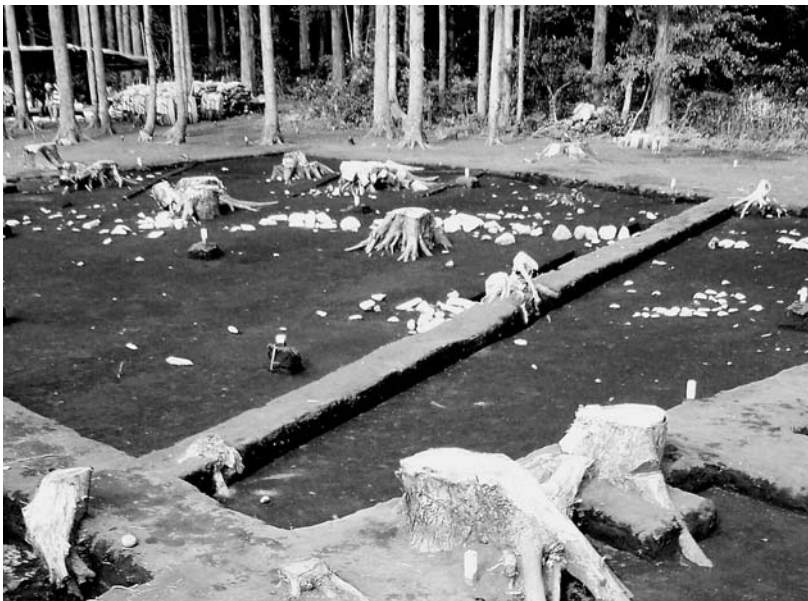
写真47 エリア①-1 環状列石D外帯 (南西→)