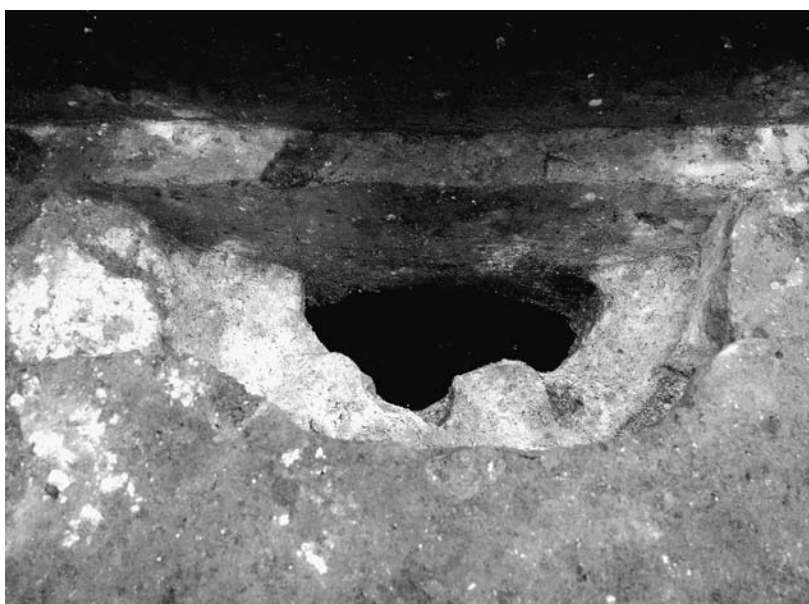
写真38 エリア①-1 柱穴13P543プラン(北→)