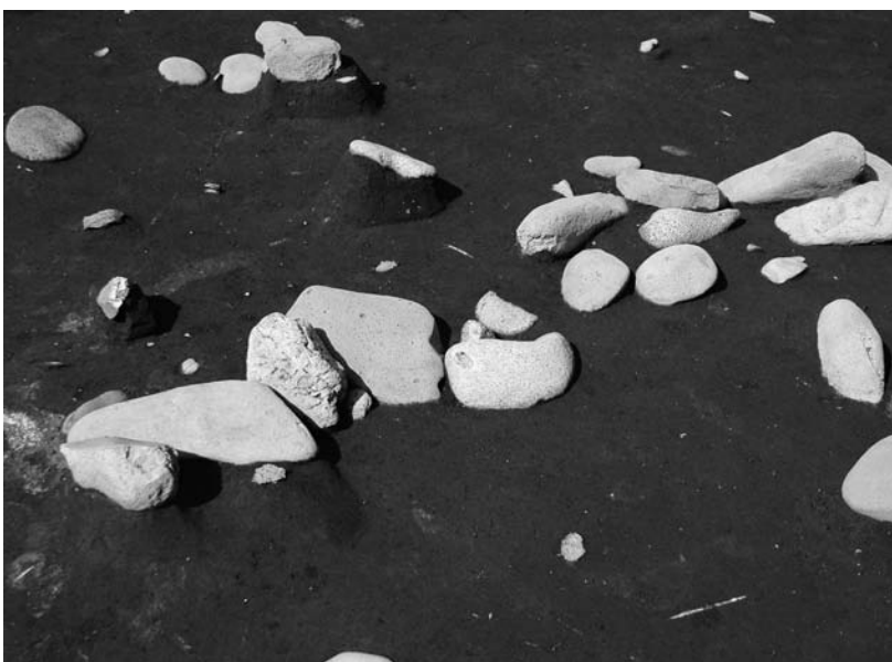
写真48 エリア①-1 環状列石Dブロック17(南東→)