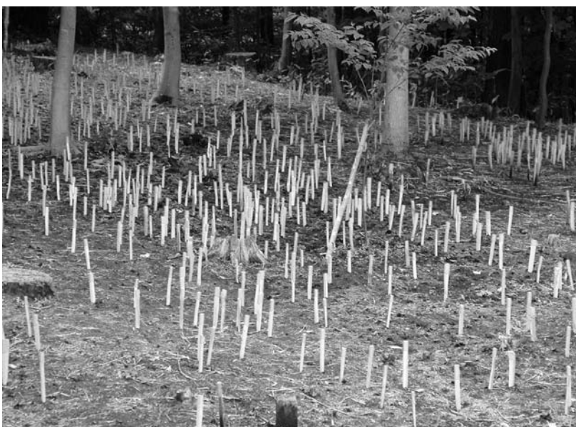
写真30 エリア①-1 環状列石Cより西 ハンドボーリング探査(東→)