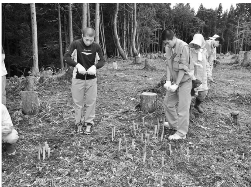
写真62 エリア①-2 ハンドボーリング探査