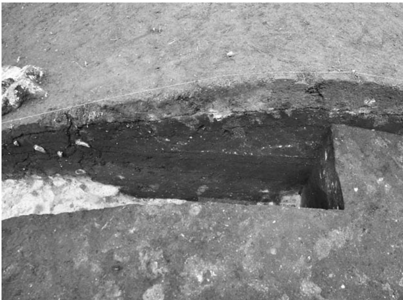
写真71 エリア①-3 土塁半截状況(東→)