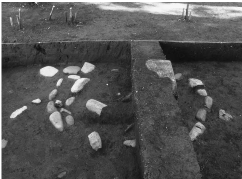
写真43 エリア①-1 環状列石D内帯(西→)