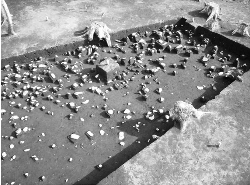
写真28 エリア①-1 環状列石Cより東 グリッドMS59礫出土状況(北西)