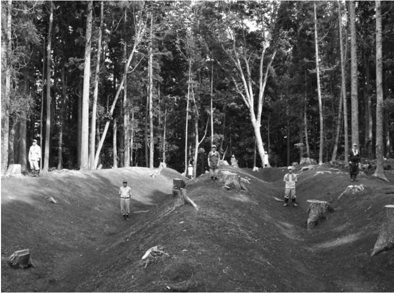
写真67 エリア①-3 壕(西→)