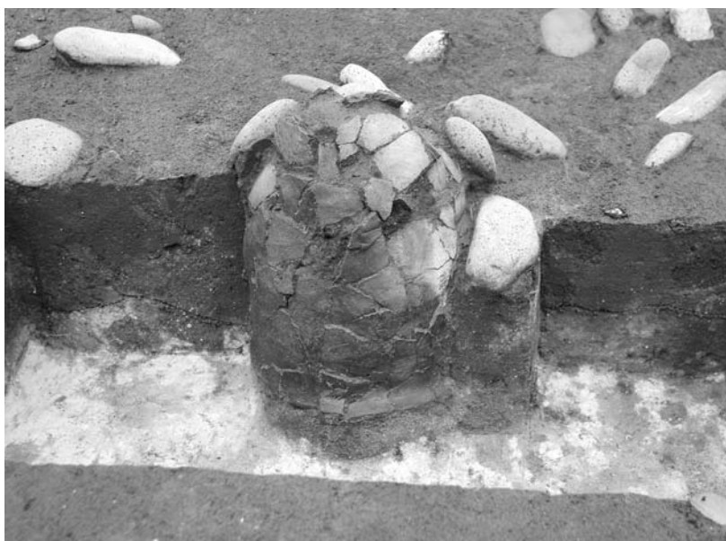
写真57 エリア①-1 埋設土器14SR571(南→)