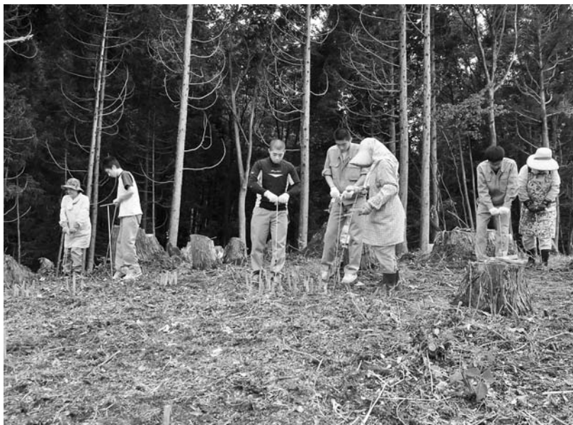
写真61 エリア①-2 ハンドボーリング探査