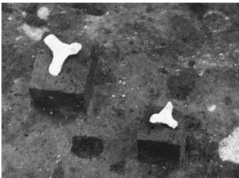
写真39 エリア①-1 13SB570三脚石器出土状況 (南東→)