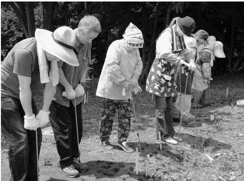
写真29 エリア①-1 ハンドボーリング探査