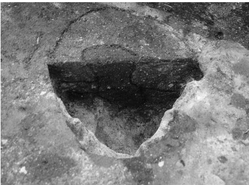
写真42 エリア①-1 13P502(東→)