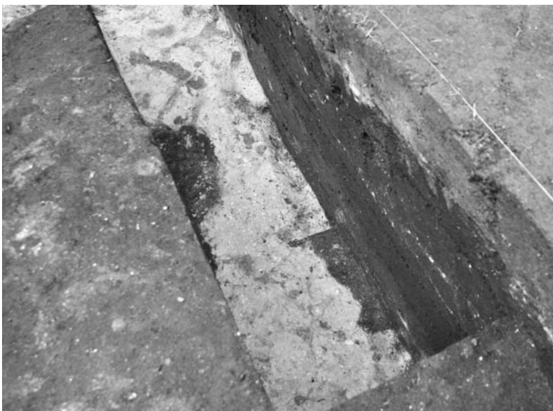
写真72 エリア①-3 土塁半截状況(北東→)