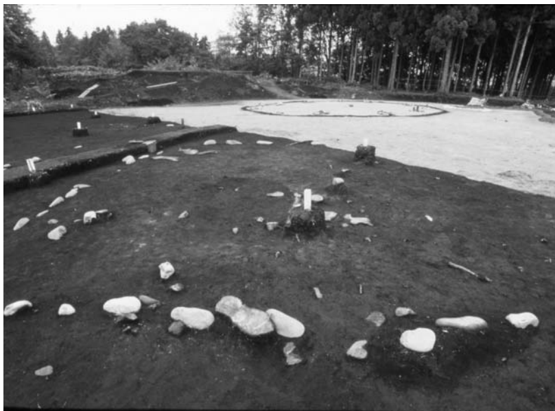
写真31 エリア①-1 環状列石 C 6 SQ01(南東→)