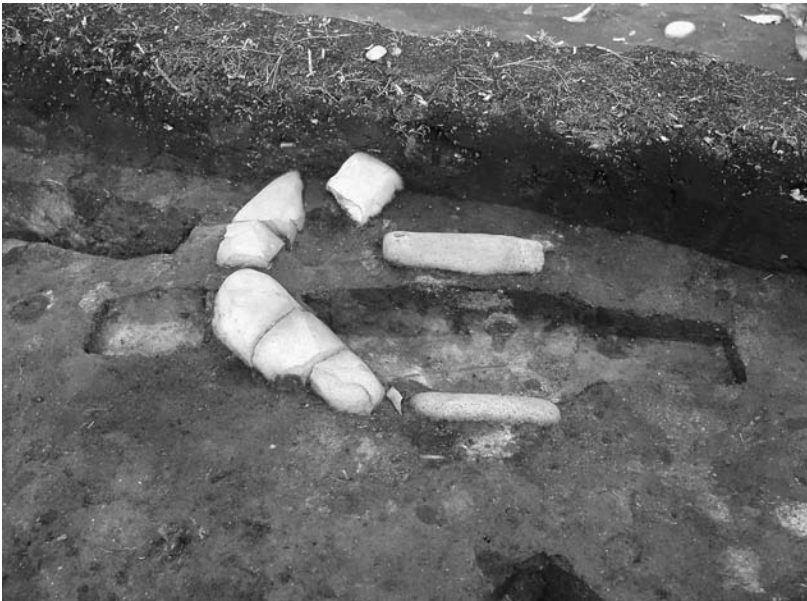
写真41 エリア①-1 13SQ407(南東→)